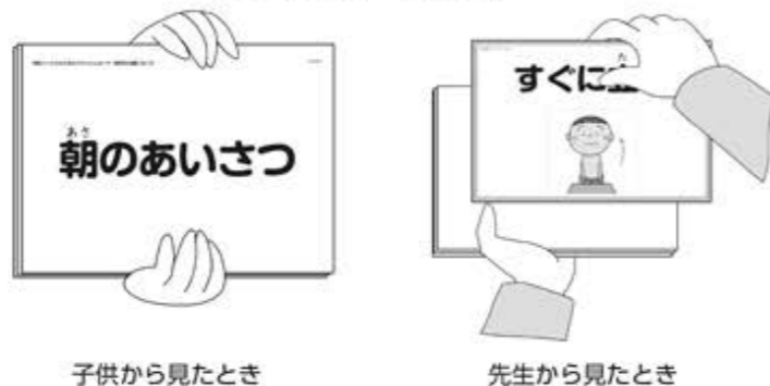
子供から見たとき