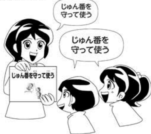
フラッシュカードの持ち方